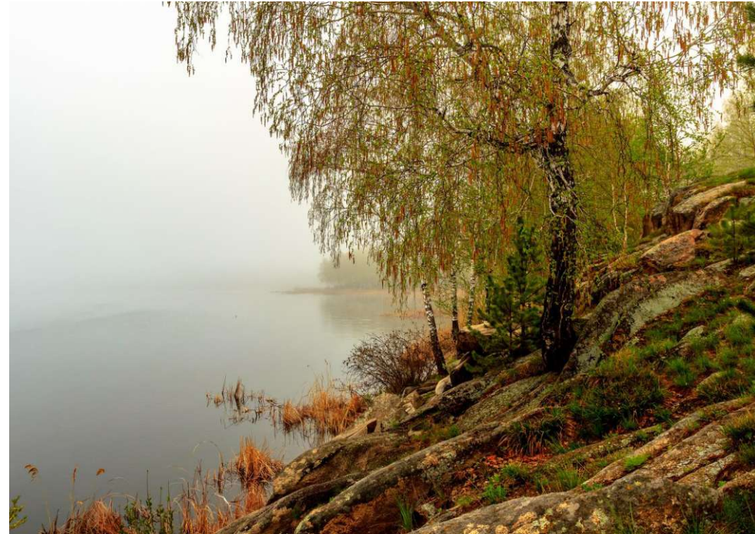
Озеро Большой Боляш