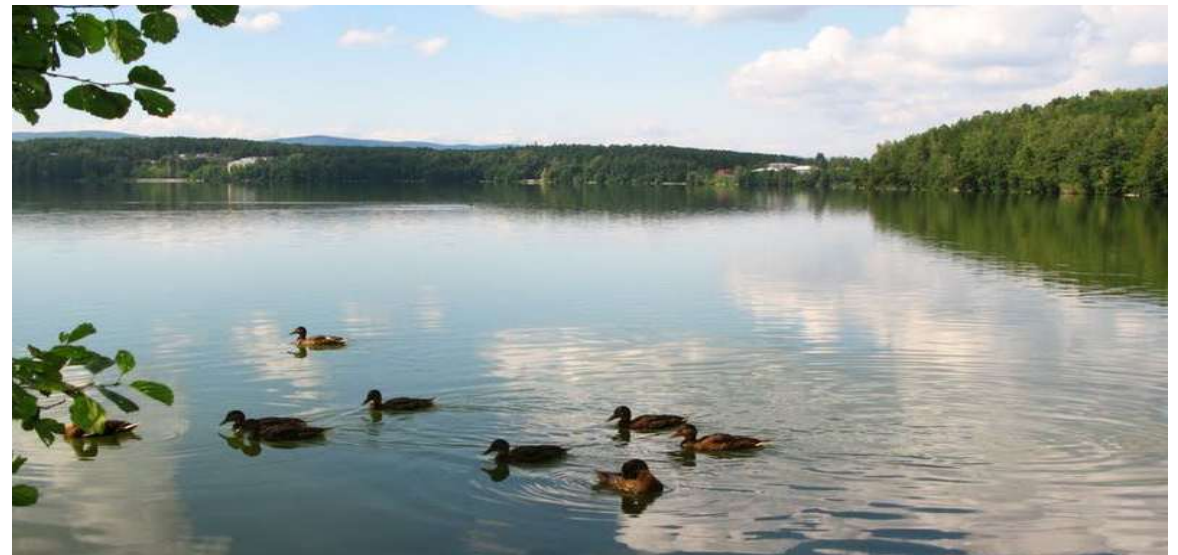
Озеро Мал. Теренкуль